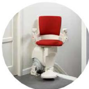
Asiento giratorio automático (opcional)