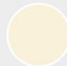
Blanco crema RAL 9001