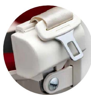
Cinturón de seguridad