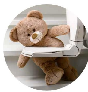
Se detiene cuando choca contra un objeto