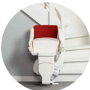
Ocupa poco espacio