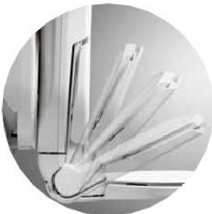
Reposapiés plegable automático

Gracias a esta tecnología inteligente, usted puede subir marcha atrás evitando así golpearse las rodillas contra la pared o la barandilla.